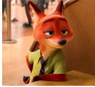
Tilki Nick Wilde