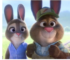
Bonnie ve Stu Hopps (Judy'nin anne ve babası)